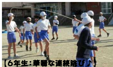
【6年生:華麗な連続跳び!】

寒風吹く12月15日(木)に、長縄集会を行いました。どの学年も休み時間を使って、くぐり抜けや連続跳びの練習を重ね、記録を伸ばしつつありました。本番でも、みんなで声をかけ合って新記録をめざし3分間跳び続けたところ、ほとんどの学年が記録を更新し、喜び合うことができました。特に6年生は、流れるような連続跳びで、何と348回の大記録を達成し、歴代最高の偉業を成し遂げました!